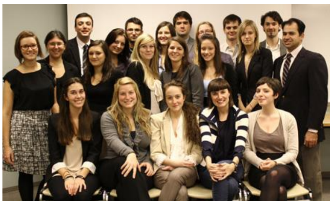
la cohorte de la session d'hiver 2012 en compagnie des professeurs et chargés de cours.