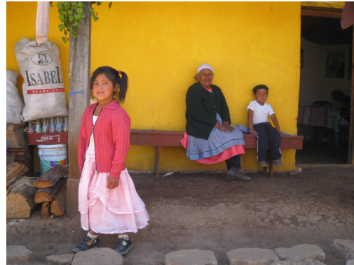
Communauté maya avec laquelle la CIDDHU collabore

question du droit à l'identité dans le cadre de la problématique des migrants haïtiens en République dominicaine et ailleurs.